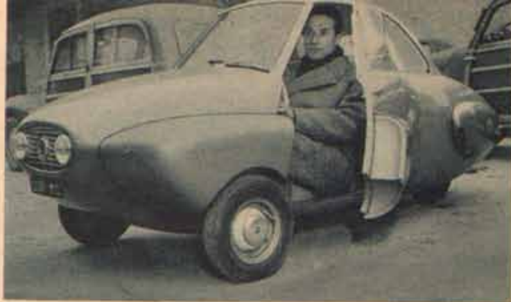
Ein Privat-Zwerg ist der von dem Mailänder Cingolani unter weitgehender Verwendung von Vespa-Roller-Teilen gebaute Zweisitzer. 125 ccm-Motor, Dreigang-Getriebe, 60 km/st.

Auf dem kommenden Turiner Automobil-Salon sind von zwei Firmen Stände belegt worden, die bisher noch nie Autos gebaut, aber einen weltweiten Ruf als Roller-Hersteller haben: Piaggio und Innocenti, die Vespa- und Lambretta-Fabrikanten. Zwar spricht man in Italien schon seit längerem von Fahrzeugen, die eine Zwischenstufe vom Motorroller zum Kleinwagen bilden sollen, aber ihr Erscheinen wurde von den evtl. daran interessierten Firmen immer wieder scharf dementiert. Was soll das nun bedeuten? Sicher ist, daß Piaggio einen solchen Kleinwagen, den wir hier „Zwerg“ nennen wollen, um ihn von andern größeren Kleinwagen zu unterscheiden, gebaut und sehr eingehend studiert hat. Es handelt sich um einen dreisitzigen 400er, der sehr niedlich sein soll. Von Innocenti wissen wir nichts Näheres. Das „Zwerg“-Thema ist in Italien überhaupt äußerst beliebt geworden. Das Erscheinen der Roller hat eine Unzahl von Menschen motorisiert, die es — besonders in Italien — sonst nie geworden wären. Es ist eine Fahrerschicht, die weder mit den Auto- noch mit den Motorradfahrern verwandt ist. Und zweifellos ist ein bedeutender Prozentsatz als potentieller zukünftiger Autofahrer zu betrachten. Der Sprung vom Roller zum — sagen wir mal — Topolino ist aber immer noch viel zu groß, und so kommt es, daß der Wunsch nach einem Zwischending, einem zweisitzigen „Zwerg“, in weiten Kreisen nicht verstummen